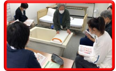
生活支援技術 (入浴)