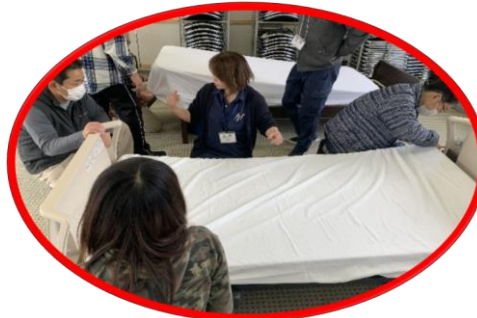
生活支援技術 (基本)