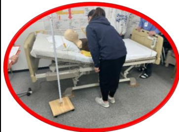
医療的ケア演習 (経管栄養演習)