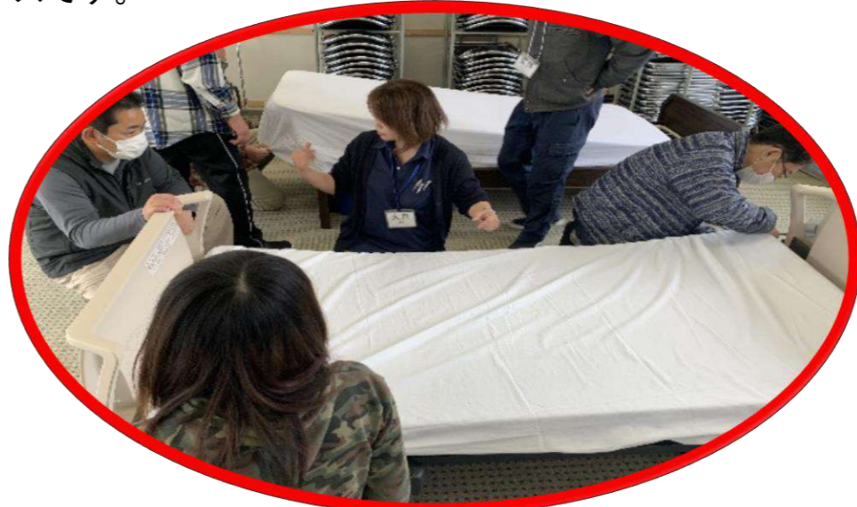
生活支援技術 (基本)