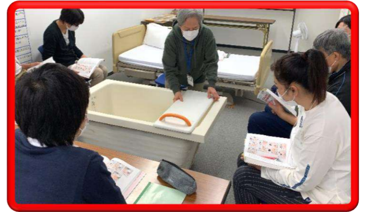
生活支援技術 (入浴)