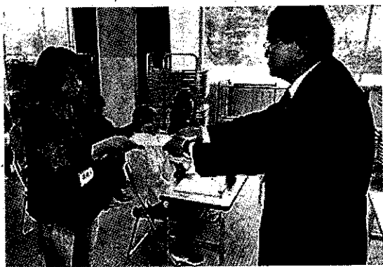
修了証を受け取る受講者＝南房総。

国の制度に基づく求職者支援訓練「介護職」の3か月間にわたる課程が修了し12日、南房総